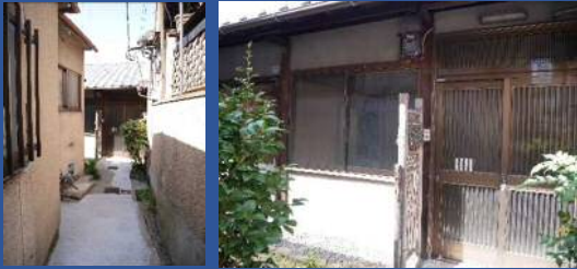
東海道より路地奥★第2種住居地域