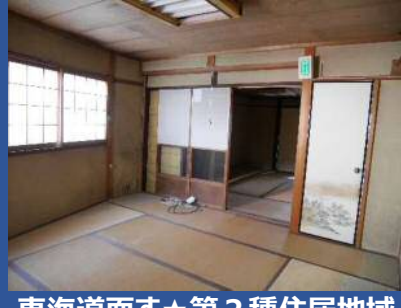
東海道面す★第2種住居地域