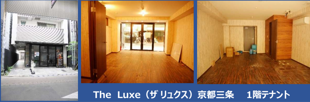
The Luxe (ザリクス) 京都三条 1階テナント