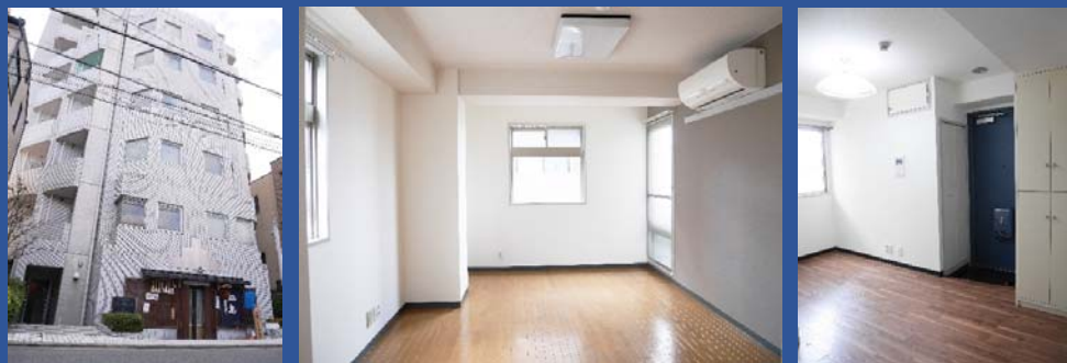
DETOM-1 NIJOJO HIGASHI