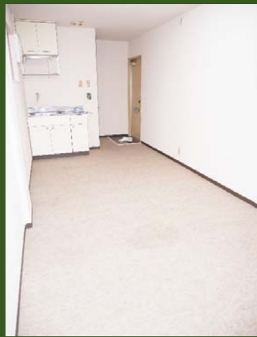
角住戸★南向き★即入居可