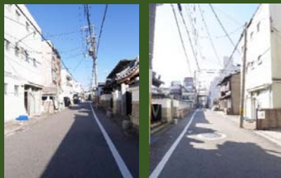
角住戸★南向き★即入居可