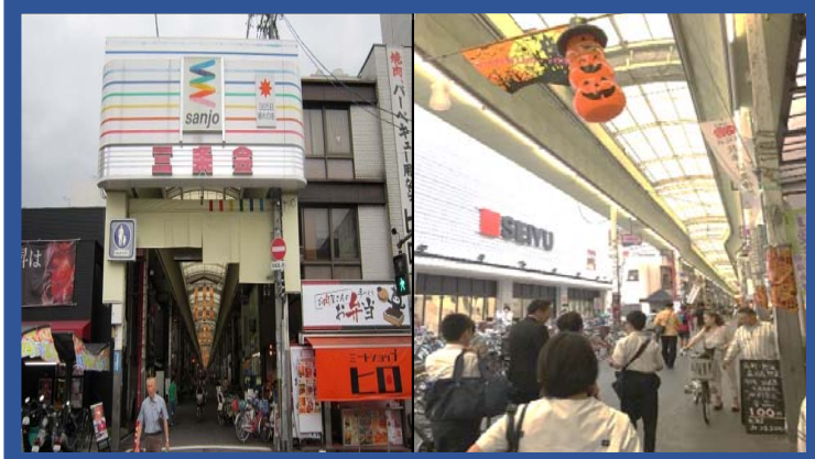
SANJO SHOPPING STREET